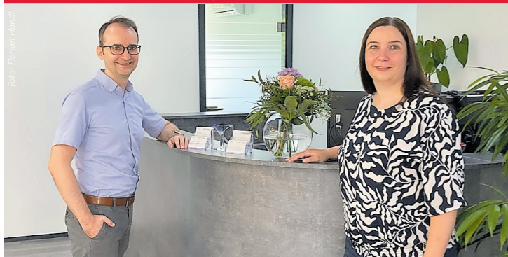
In den freundlichen, hellen und klimatisierten Räumen empfangen die Steuerberater und Steuerberaterinnen ihre Kunden gerne.