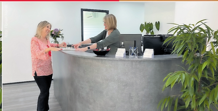
Kollegialer und partnerschaftlicher Umgang zwischen den Kolleginnen und Kollegen ist bei Scholl + Partner ein großes Plus.